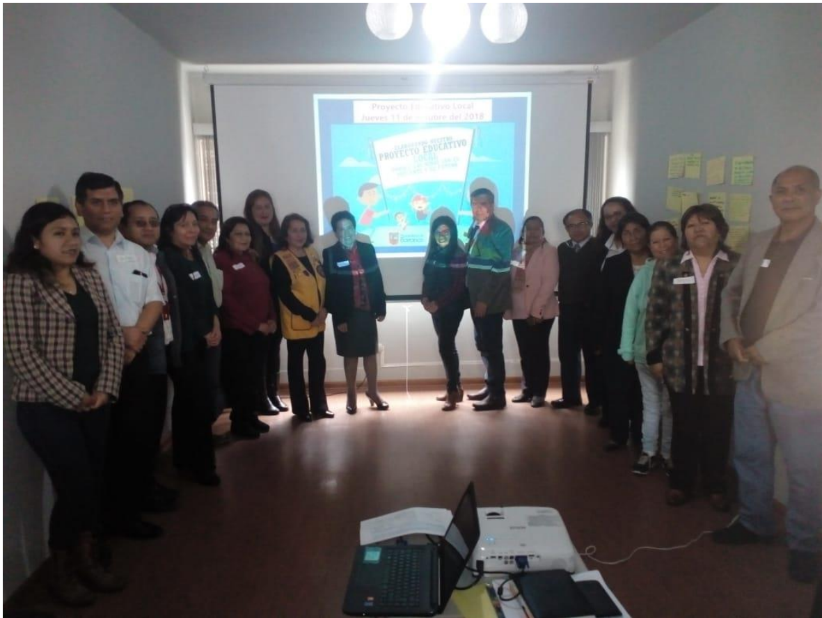
Talleres participativos con actores locales