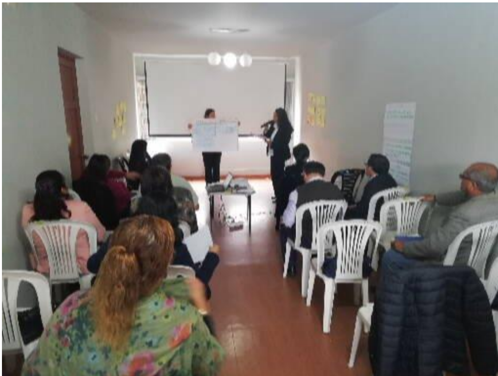
Talleres participativos con actores locales