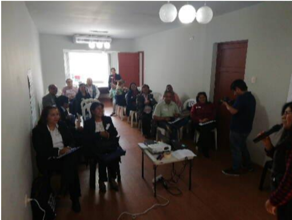
Talleres participativos con actores locales